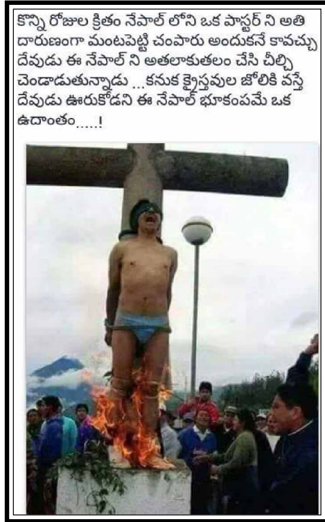
కొన్ని రోజుల క్రితం నేపాల్ లోని ఒక పాస్టర్ ని అతి దారుణంగా మంటపెట్టి చంపారు అందుకనే కావచ్చు దేవుడు ఈ నేపాల్ ని అతలాకుతలం చేసి చీల్చి చెండాడుతున్నాడు... కనుక క్రైస్తవుల జోలికి వస్తే దేవుడు ఊరుకోడని ఈ నేపాల్ భూకంపమే ఒక ఉదాంతం.....!

ప్రత్యేకంగా మన పరచర్యల కోసం ప్రార్థించండి. టి.వి. పరిచర్య కోసం, ఐ.ఈ.ఆర్.ఎఫ్ లోని అన్నీ విభాగాలను ప్రభువు సన్నిధిలో జ్ఞాపకం చేసుకోండి. “పరిశుద్ధత” మానవత్రికను మీ బంధువులు, స్నేహితులకు పరిచయం చేసి వారితో చందా కట్టించగలిగిన యెడల మీరు “పరిశుద్ధ గ్రంథము” బహుమతిగా పొందే అవకాశం వుంది. మీ పిల్లలను విరామ బైబిల్ పాఠశాలకు పంపండి. మీరు కూడా సువార్త సభలకు వెళ్ళి ఆత్మీయ మేలులు పొందండి. ఈ వేసవిలో దేవుడు నా మీద చాలా భారం పెట్టాడు. అనేక ప్రాంతాలలో సువార్త సభలు జరిగించాలి. నా కోసం, పరిచర్య కోసం ఎప్పటిలాగానే మీ ప్రార్థనలలో జ్ఞాపకం చేసుకుంటారని ఆశిస్తున్నాను. దేవుడు మిమ్మును దీవించును గాక!